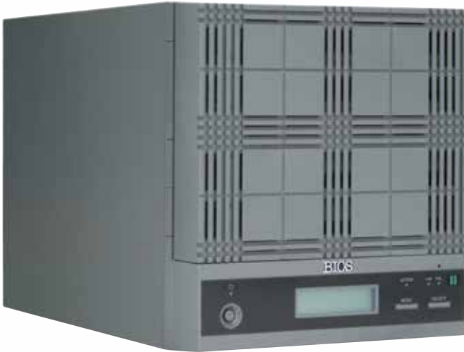
▲ MX404N312 / MX404NAS3 モデル

※MX404N312 = CPU - i3 実装、OS - WSS2012R2 搭載。 ※MX404NAS3 = CPU - i3 実装、OS - WSS2008R2 搭載。