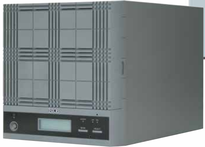
▲ MX404SV3 モデル

※MX404N312 = CPU - i3 実装、OS - WSS2012R2 搭載。 ※MX404NAS3 = CPU - i3 実装、OS - WSS2008R2 搭載。