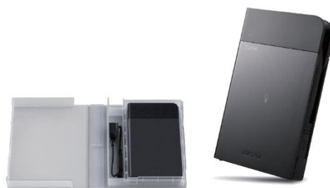
EP25SB3 シリーズ (専用ケース付き)